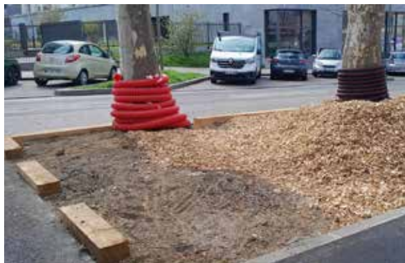
Pieds d'arbres avenue Félix Faure

Aujourd'hui, la Métropole de Lyon installe des arbres de pluie qui favorisent l'infiltration de l'eau et qui permettent aussi aux arbres d'être arrosés par les pluies, si précieuses par temps de sécheresse.