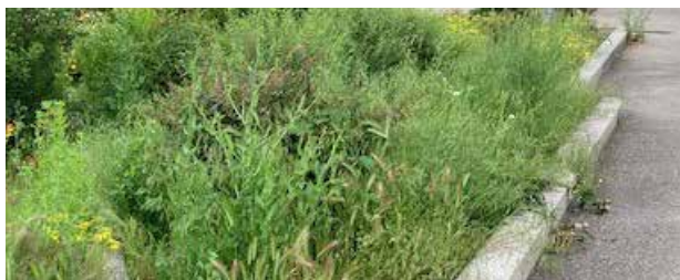
Jardins de pluie, place de la Mairie

Un revêtement poreux a été mis en place sur le trottoir du Boulevard des Oiseaux.