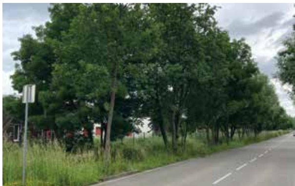
Noue rue de la République

Ces noues, agrémentées de nombreux arbres, apportent aussi de la fraîcheur aux promeneurs.